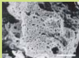
ランドプラスの顕微鏡写真