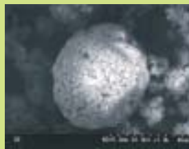
シーキュラスの顕微鏡写真